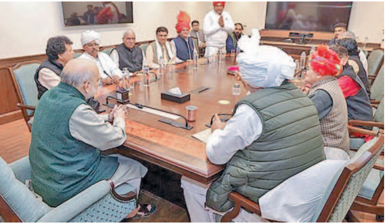
ఢిల్లీ ఎన్నికల సందర్భంగా ఆదివారం పార్టీ ప్రతినిధులతో సమావేశమైన కేంద్రమంత్రి లమకేశి