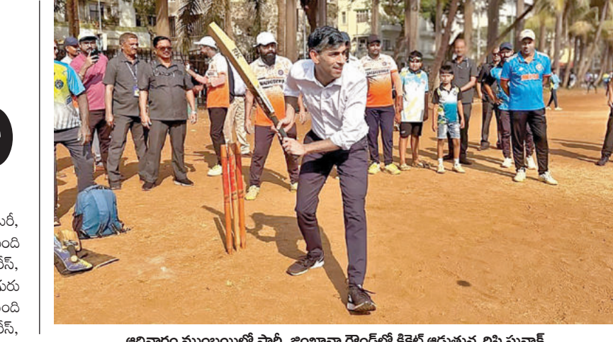
ఆదివారం ముంబయిలో పార్టీ జింజానా గ్రౌండ్ లో క్రికెట్ ఆడుతున్న లిషి సునాక్

ఎమినిటీస్ సెక్టర్, వార్డ్ శానిటేషన్ సెక్టర్, వార్డు ఎనర్జీ సెక్టర్ వస్తారు. 2500 మంది లోపు జనాభాకు ఇద్దరు మల్టీపర్సన్ ఫంక్షనరీస్, నలుగురు టెక్నికల్ ఫంక్షనరీస్ కలిపి అరుగురు ఉంటారు. 2500 నుంచి 3500 మంది జనాభాకు ముగ్గురు మల్టీ పర్సన్ ఫంక్షనరీస్, నలుగురు టెక్నికల్ ఫంక్షనరీస్ కలిపి ఏడుగురు ఉంటారు. 3501 నుంచి ఆ పై జనాభాకు నలుగురు మల్టీ పర్సన్ ఫంక్షనరీస్, నలుగురు టెక్నికల్ ఫంక్షనరీస్ కలిపి ఎనిమిది మంది ఉంటారు. ఈ విధంగా రేషనలైజేషన్ చేస్తే 2500లోపు జనాభా కలిగిన ప్రాంతంలో అరుగురు సిబ్బందితో 3,562 గ్రామ, వార్డు సచివాలయాలు ఉంటాయి. 2500 నుంచి 3500 మంది జనాభా కలిగిన ప్రాంతంలో ఏడుగురు సిబ్బందితో 5,388 గ్రామ, వార్డు సచివాలయాలు ఉంటాయి. 3500 పైగా జనాభా కలిగిన ప్రాంతంలో 8 మంది సిబ్బందితో 6054 గ్రామ, వార్డు సచివాలయాలు ఉంటాయి. మొత్తం 15,004 గ్రామ, వార్డు సచివాలయాలు ఉంటాయి. కనీసం 2500 జనాభాకు లేదా 5 కి.మీ పరిధిలో ఒక సెక్టోరియల్ ఉండాలని సిఎం సూచించారు. ఏకైక ప్రాంతంలో అవసరం అయితే అదనంగా సచివాలయాలు పెంచాలని సూచించారు. గతంలో ప్రతిపాదించిన విధానం ప్రకారం మొత్తం 1,61,000 సచివాలయ ఉద్యోగులు >>2