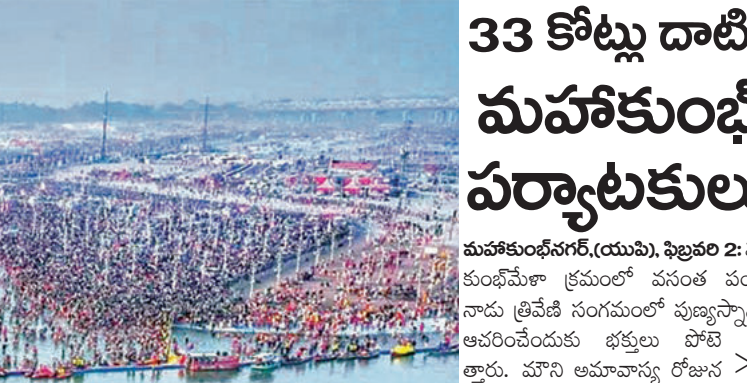
33 కోట్లు దాటిన మహాకుంభ పర్యాటకులు

ప్రతి జిల్లాకు సైబర్ సెక్యూరిటీ పోలీసు స్టేషన్: డిజిపి గుప్తా మన్నారు, గంజాయి. మాదక ద్రవ్యాల అక్రమ రవాణా, వినియోగంపై ఉక్కుపాదం పెడతా మన్నారు ఆ దిశలో కఠినమైన చర్యలు తీసుకుంటామన్నారు. విజన్ 2047 కోసం పోలీస్ శాఖ సహకరిస్తుందన్నారు. సీసీటీవీ కెమెరాలను పెంచడంతోపాటు నేరపూరిత ప్రదేశాల్లో నేరస్తులను గుర్తించే వారికి శిక్షలు వడతా చర్యలు తీసుకుంటామన్నారు. ట్రాఫిక్ సమస్యలను పరిష్కరించేందుకు చర్యలు చేపడతామని, నార్కోటిక్స్ విభాగాన్ని బలోపేతం చేస్తామని వెల్లడించారు. పోలీస్ వెల్ఫేర్ తోపాటు పోలీస్ శాఖలో ప్రమోషన్స్ త్వరితగతిన వచ్చే విధంగా కృషి చేస్తామన్నారు. కనీసం డిప్యూటీ డిప్యూటీ సెల్యూని పోలీస్ అధికారులకు ఆయన సూచించారు.